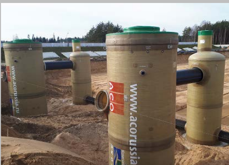
Индустриальный парк "Великий камень" "Оборудование для очистки поверхностного стока в составе ЛОС накопительного типа с самым большим в мире безбетонным аккумулярующим резервуаром АСО StormBrixx, Минск, Республика Беларусь